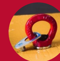
Punkty do podnoszenia